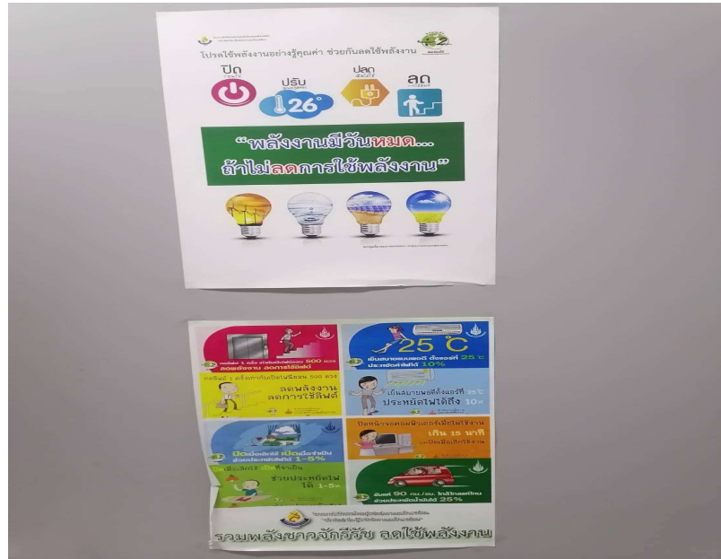
ภาพที่ 23 แสดงป้ายประกาศต่างๆ ของโครงการ

รายงานผลการปฏิบัติตามมาตรการป้องกันและแก้ไขผลกระทบสิ่งแวดล้อม และมาตรการติดตามตรวจสอบผลกระทบสิ่งแวดล้อม (ระยะดำเนินการ ประจำปีเดือนกรกฎาคม-ธันวาคม 2567) ของโครงการ โรงแรม เรด แพลนเน็ต