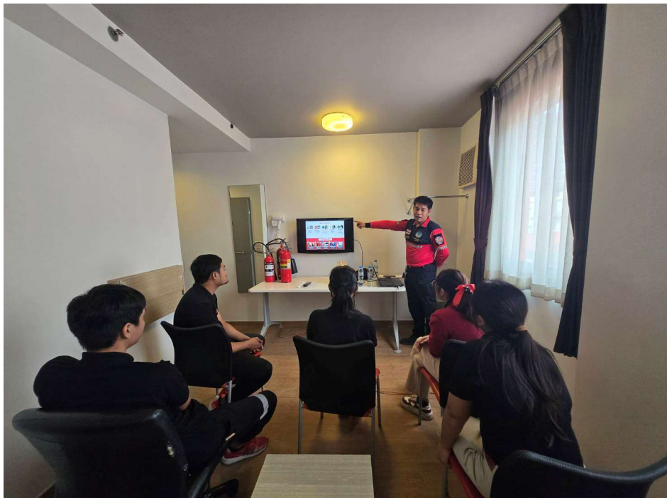
ภาพที่ 44 แสดงการฝึกซ้อมอบรมดับเพลิง