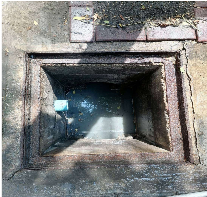
ภาพที่ 40 ทำความสะอาดขุดลอก Manhole บ่อหน่วงน้ำและท่อระบายน้ำ ของโครงการ