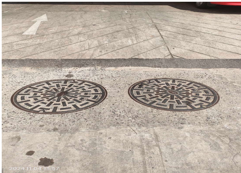
ภาพที่ 29 แสดงภาพ บ่อหน่วงน้ำ ของโครงการ