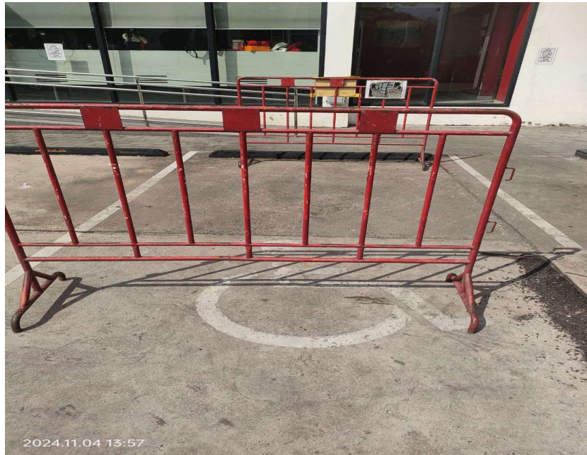
ภาพที่ 5 แสดงลานจอดรถสำหรับผู้พิการ