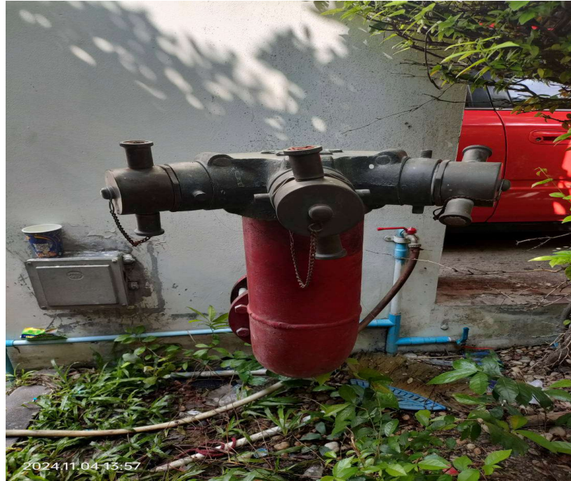
ภาพที่ 7 แสดงหัวรับน้ำดับเพลิง