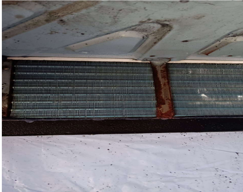
ภาพที่ 33 สภาพเครื่องปรับอากาศก่อนทำความสะอาด