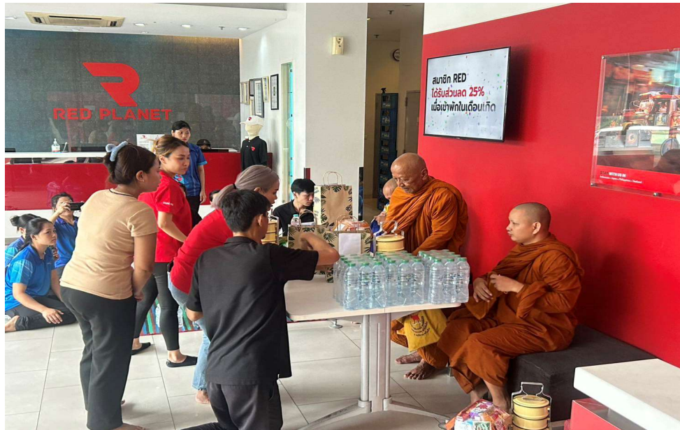
ภาพที่ 41 กิจกรรมตามประเพณี

รายงานผลการปฏิบัติตามมาตรการป้องกันและแก้ไขผลกระทบสิ่งแวดล้อม และมาตรการติดตามตรวจสอบผลกระทบสิ่งแวดล้อม (ระยะดำเนินการ ประจำเดือนกรกฎาคม-ธันวาคม 2567) ของโครงการ โรงแรม เรด แพลนเน็ต