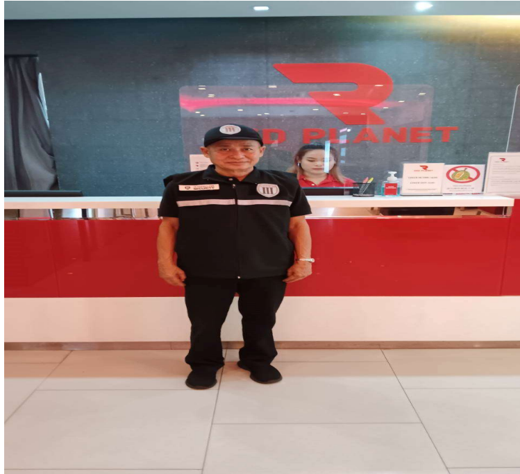
ภาพที่ 37 เจ้าหน้าที่รักษาความปลอดภัย ของโครงการ

รายงานผลการปฏิบัติตามมาตรการป้องกันและแก้ไขผลกระทบสิ่งแวดล้อม และมาตรการติดตามตรวจสอบผลกระทบสิ่งแวดล้อม (ระยะดำเนินการ ประจำปีเดือนกรกฎาคม-ธันวาคม 2567) ของโครงการ โรงแรม เรด แพลนเน็ต