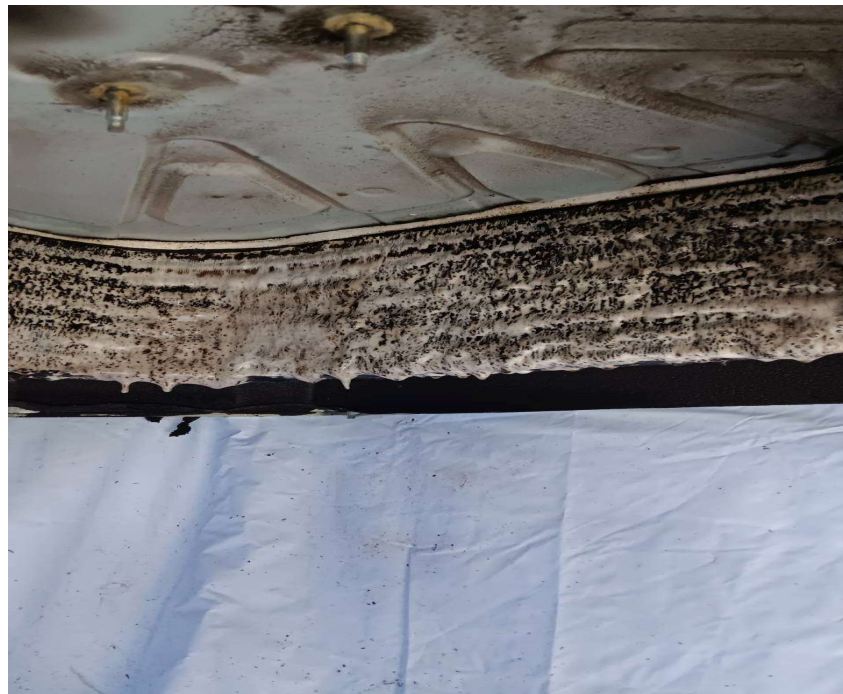
ภาพที่ 32 ห้องพัก ที่เจ้าหน้าที่ทำการล้างเครื่องปรับอากาศภายในโครงการ