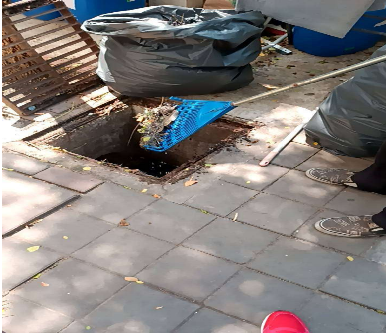
ภาพที่ 39 ทำความสะอาดขุดลอก Manhole บ่อหน่วงน้ำและท่อระบายน้ำ ของโครงการ