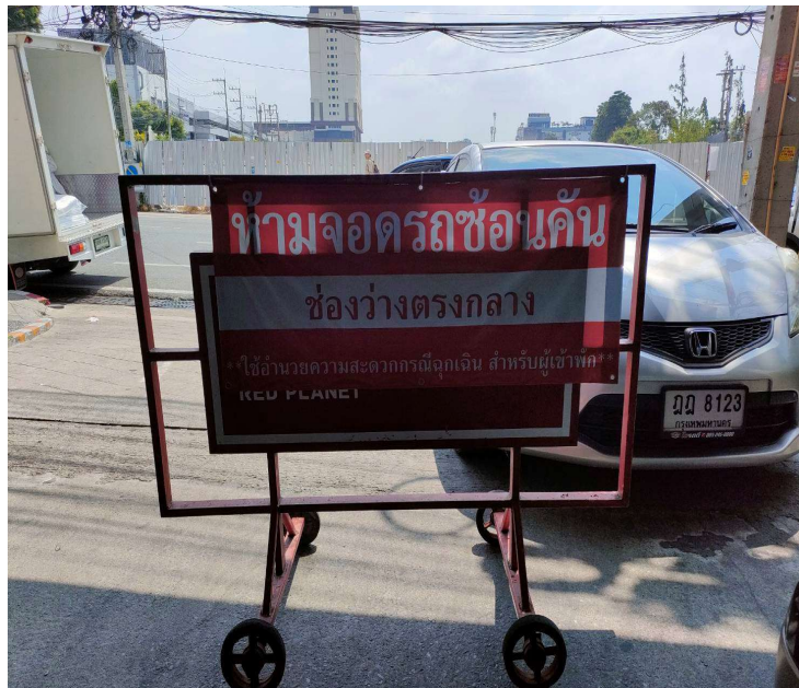
ภาพที่ 38 ป้าย “ใช้ความเร็วไม่เกิน 30 กิโลเมตร/ชั่วโมง” ของโครงการ