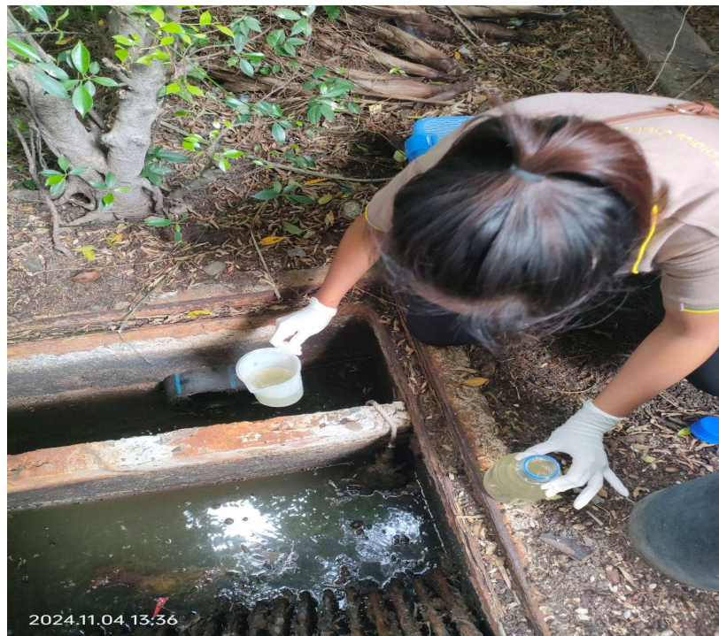
ภาพที่ 20 แสดงเจ้าหน้าที่เก็บตัวอย่าง