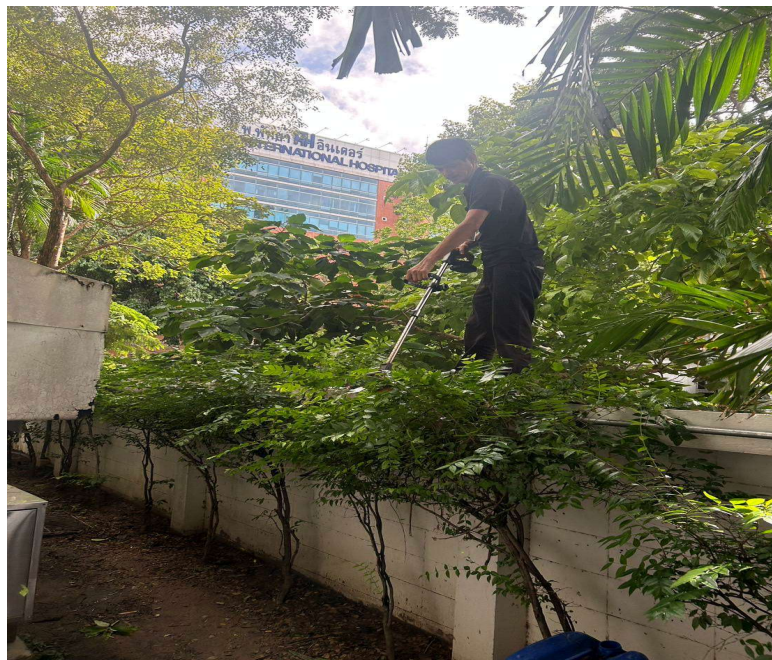
ภาพที่ 36 เจ้าหน้าที่ดูแลรักษาดันไม้ในบริเวณโครงการ