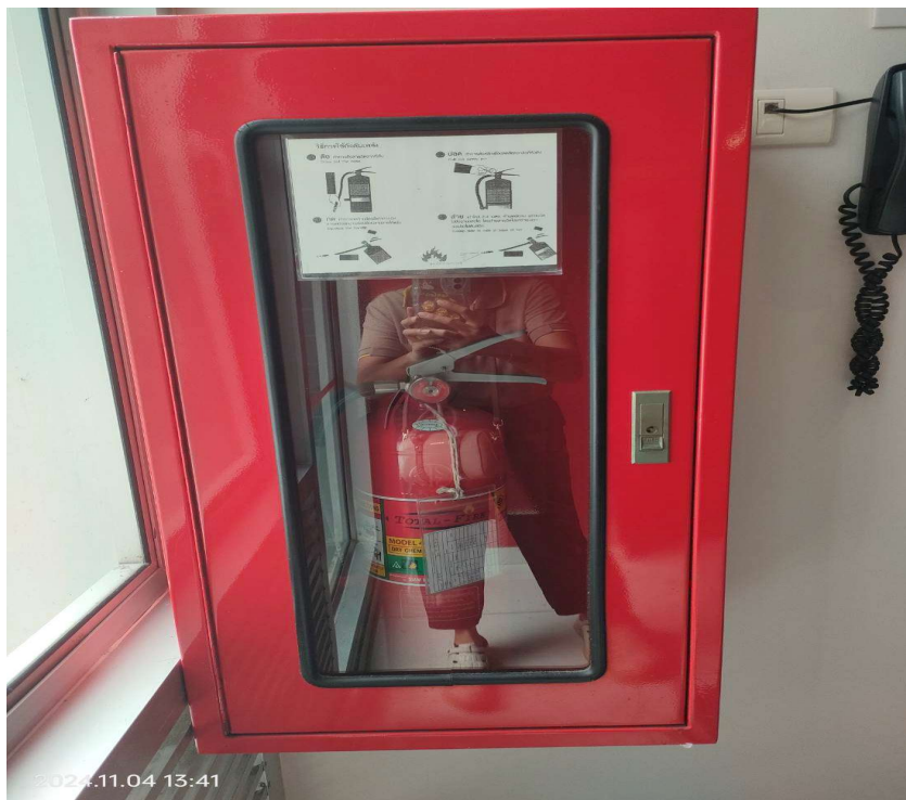
ภาพที่ 6 แสดงถังดับเพลิง และป้ายแสดงจุดติดตั้ง