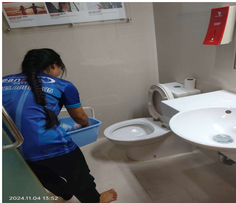
ภาพที่ 26 เจ้าหน้าที่ทำความสะอาดห้องพัก ของโครงการ