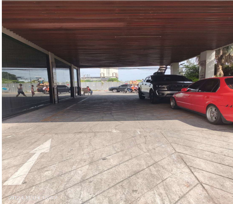
ภาพที่ 15 แสดงลูกศรทิศทางการเดินรถ ภายในโครงการ