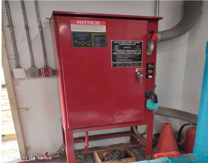
ภาพที่ 9 แสดงตู้ควบคุมระบบดับเพลิง ภายในโครงการ