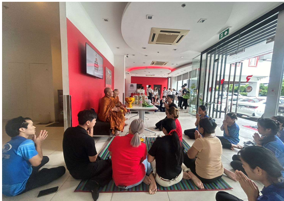
ภาพที่ 42 กิจกรรมตามประเพณี