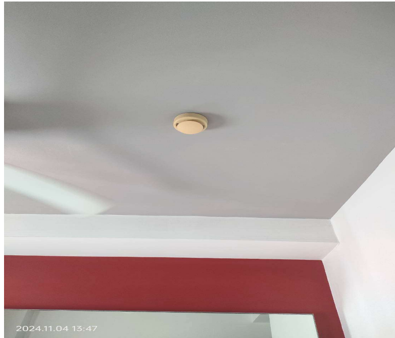
ภาพที่ 11 แสดง เครื่องตรวจจับความร้อน ภายในห้องพักของโครงการ