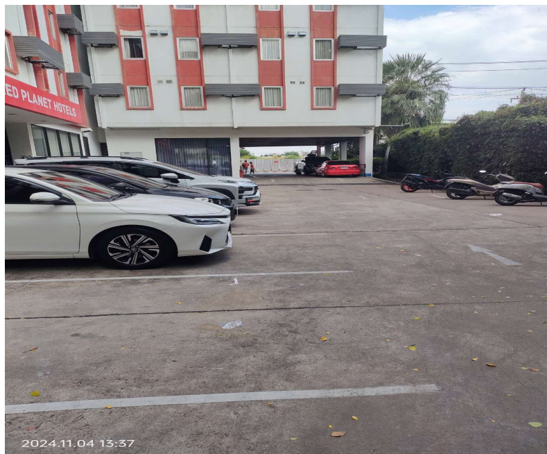
ภาพที่ 4 แสดงลานจอดรถยนต์