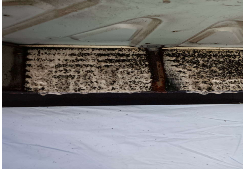
ภาพที่ 31 เจ้าหน้าที่ทำการล้างเครื่องปรับอากาศภายในโครงการ