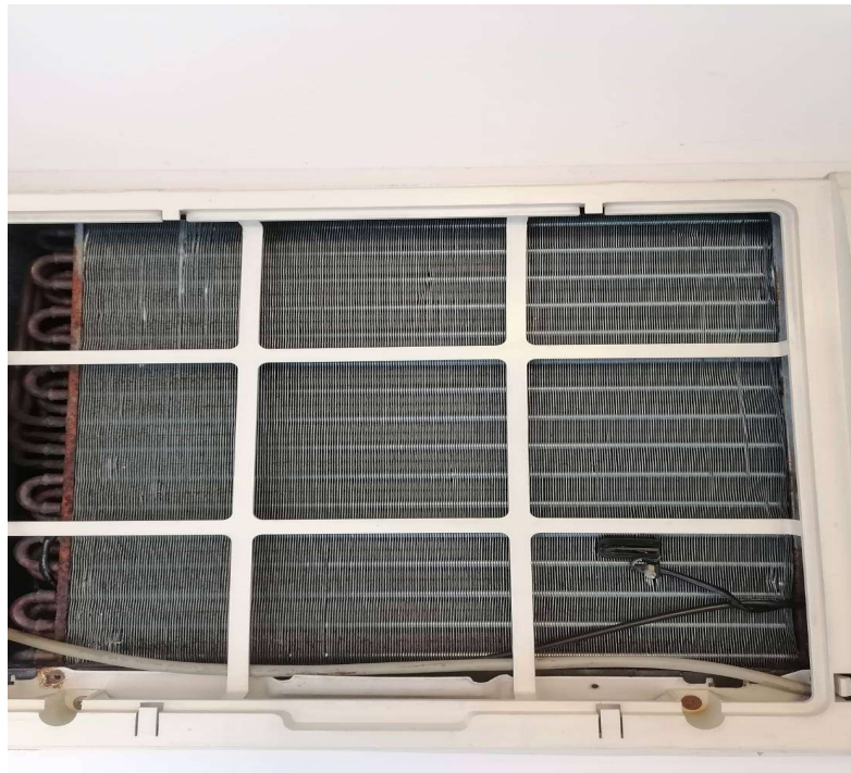
ภาพที่ 34 สภาพเครื่องปรับอากาศหลังทำความสะอาด