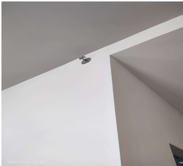
ภาพที่ 12 แสดงระบบดับเพลิงอัตโนมัติ