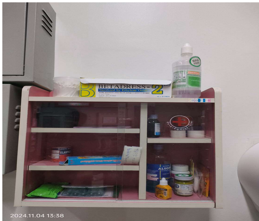
ภาพที่ 18 แสดงชุดปฐมพยาบาลเบื้องต้น