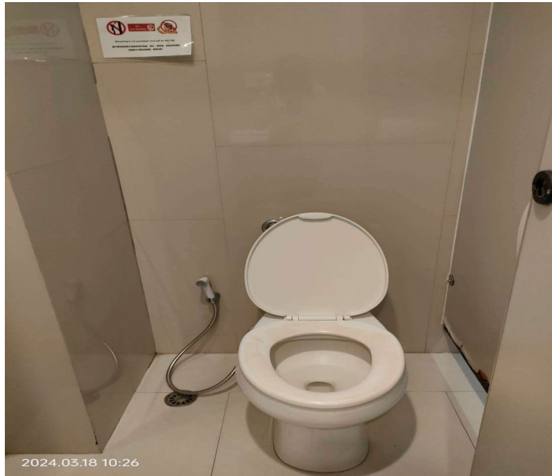
ภาพที่ 25 แสดงป้ายรณรงค์ไม่ให้ทิ้งขยะลงในชักโครก

รายงานผลการปฏิบัติตามมาตรการป้องกันและแก้ไขผลกระทบสิ่งแวดล้อม และมาตรการติดตามตรวจสอบผลกระทบสิ่งแวดล้อม (ระยะดำเนินการ ประจำปีเดือนกรกฎาคม-ธันวาคม 2567) ของโครงการ โรงแรม เรด แพลนนด