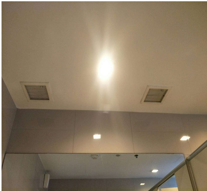
ภาพที่ 10 แสดงระบบระบายอากาศ ภายในห้องน้ำของโครงการ