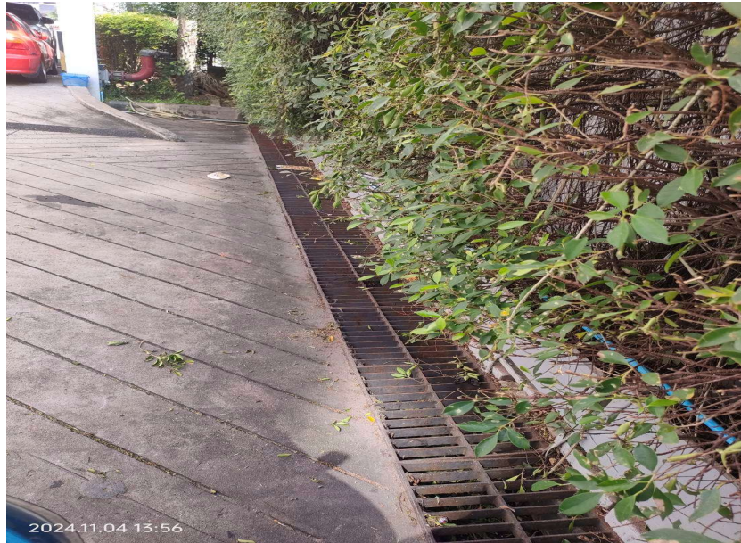
ภาพที่ 19 แสดงลำรางระบายน้ำ