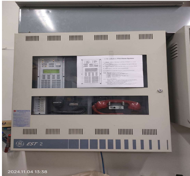
ภาพที่ 35 ระบบ Fire Alarm System ของโครงการ