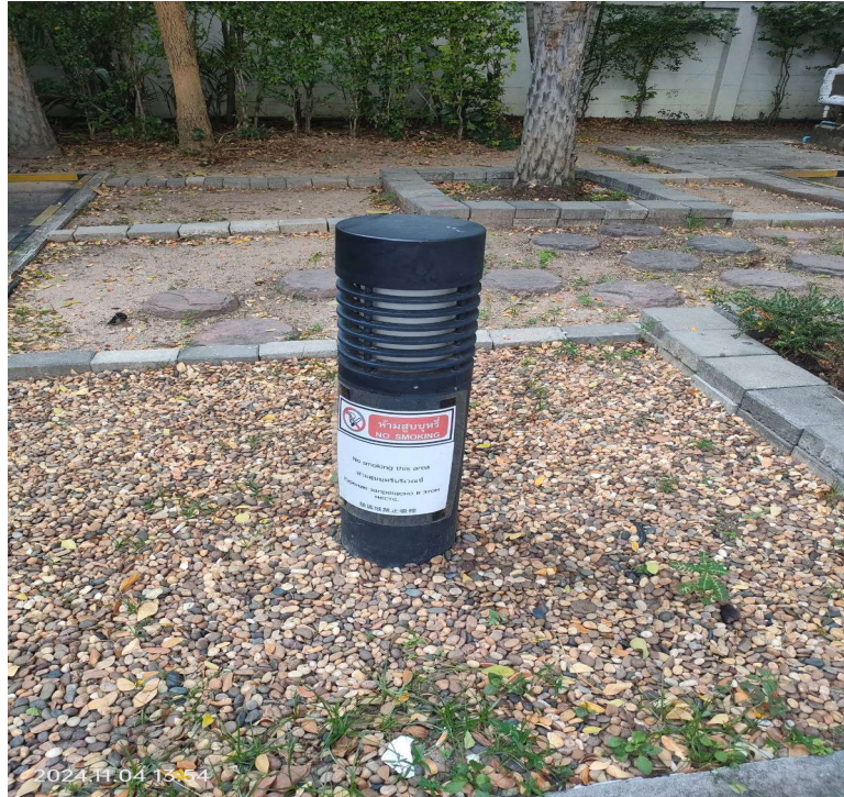
ภาพที่ 27 แสดงไฟส่องสว่าง ภายในโครงการ

รายงานผลการปฏิบัติตามมาตรการป้องกันและแก้ไขผลกระทบสิ่งแวดล้อม และมาตรการติดตามตรวจสอบผลกระทบสิ่งแวดล้อม (ระยะดำเนินการ ประจำปีเดือนกรกฎาคม-ธันวาคม 2567) ของโครงการ โรงแรม เรด แพลเนต