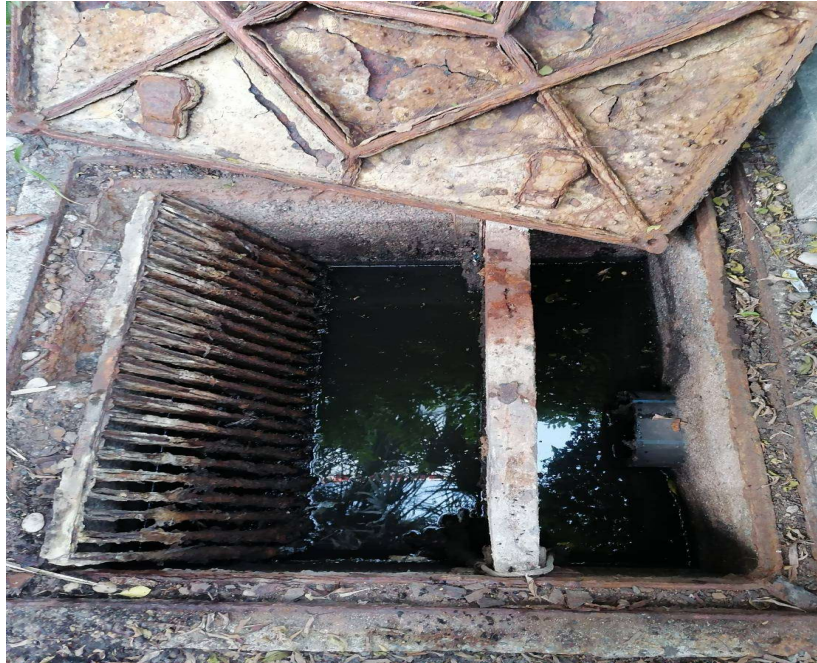
ภาพที่ 21 แสดงบ่อบำบัดน้ำเสียที่ติดตั้งตะแกรงดักมูลฝอย