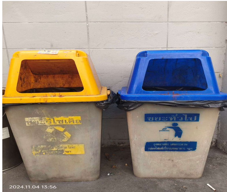
ภาพที่ 3 แสดงถังขยะ ภายในโครงการ