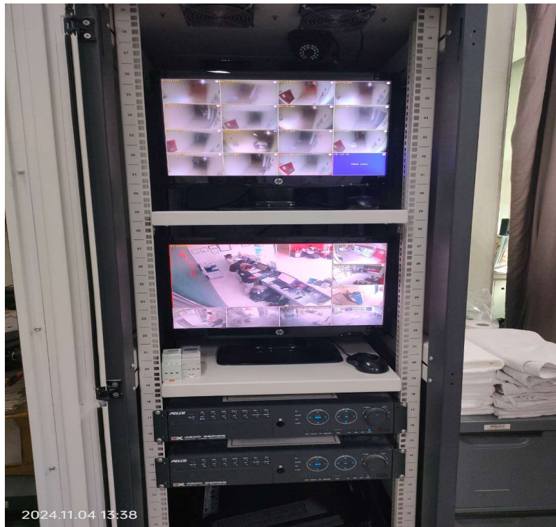
ภาพที่ 22 แสดงกล้องวงจรปิดภายในโครงการ