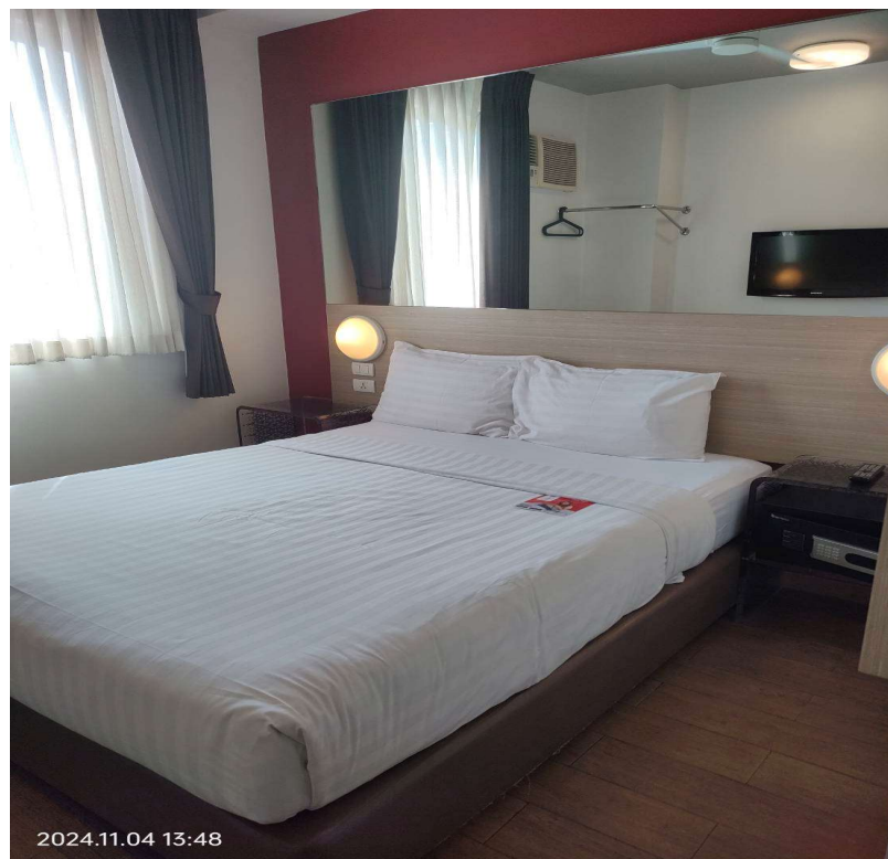
ภาพที่ 24 แสดงตัวอย่างห้องพัก ภายใน โครงการ