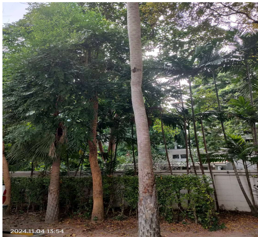
ภาพที่ 2 แสดงพื้นที่สีเขียวของโครงการ