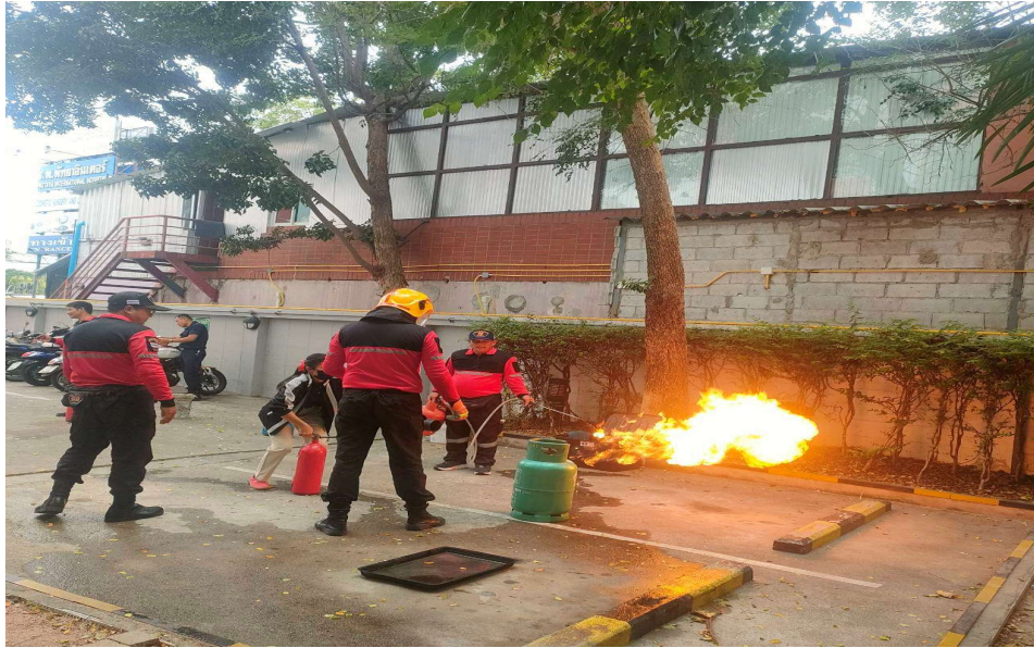
ภาพที่ 43 แสดงการฝึกซ้อมดับเพลิง