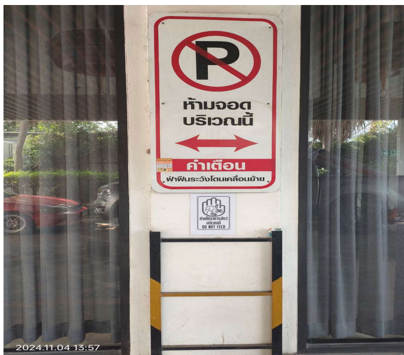
ภาพที่ 30 แสดงป้ายเตือน ห้ามจอด ภายในโครงการ