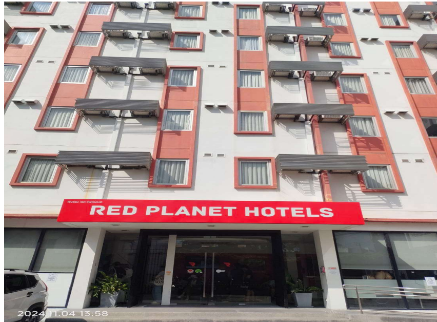
ภาพที่ 1 แสดงป้ายชื่อโครงการ

รายงานผลการปฏิบัติตามมาตรการป้องกันและแก้ไขผลกระทบสิ่งแวดล้อม และมาตรการติดตามตรวจสอบผลกระทบสิ่งแวดล้อม (ระยะดำเนินการ ประจำปีงบประมาณ-ธันวาคม 2567) ของโครงการ โรงแรม เรด แพลนเน็ต