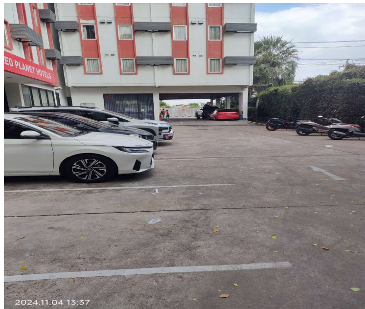
ภาพที่ 28 แสดงสภาพถนน ภายในโครงการ