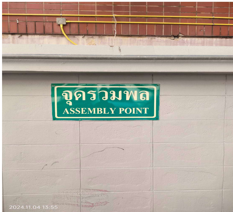
ภาพที่ 16 แสดงป้ายจุดรวมพล