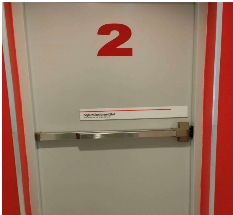
ภาพที่ 14 แสดงประตูหนีไฟ