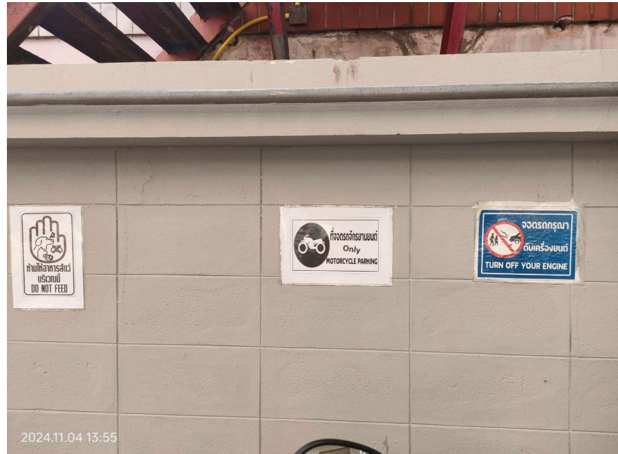
ภาพที่ 17 แสดงป้ายข้อความ เตือน โปรดดับเครื่องยนต์ขณะจอด